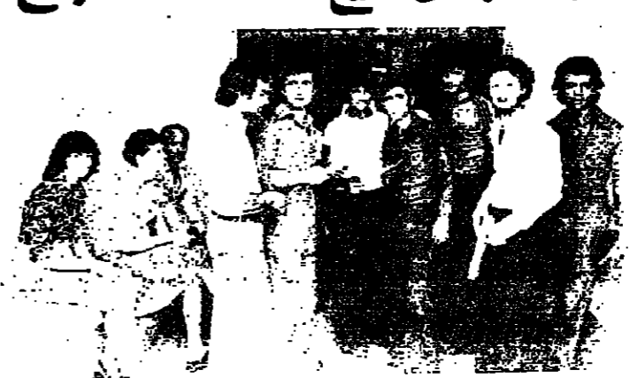
طالبات وطلاب سلموا اعدادهم لآخرين بنظرون

بدأت دائرة التربية في صيدا امس، باعطاء افادات النجاح مع الامتحانات للثانويات والكليات باقسامها المختلفة والعلوم الاختيارية والرياضيات.